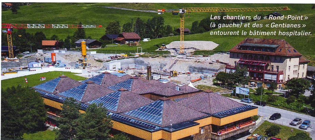
Les chantiers du « Rond-Point » (à gauche) et des « Gentianes » entourent le bâtiment hospitalier.